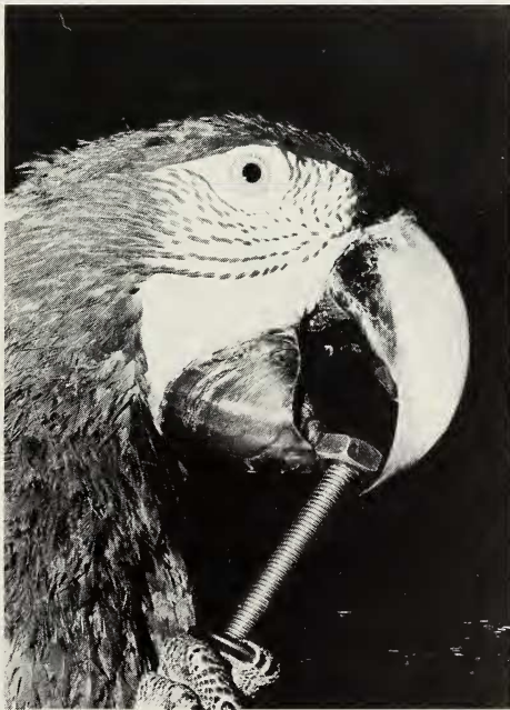
Abb. 2: Eine Mutter wird auf die Schraube gebracht

Begehrtes Spielzeug trugen die Aras lange mit sich herum, legten es beim Fressen in den Napf, um es darauf gleich wieder zu nehmen. Gelegentlich trug das ♂ alle Spielsachen auf das Dach des Brutkastens und legte sie dicht zusammen oder aufeinander: Schlüsselringe, Schrauben, Muttern, Flaschenöffner. Immer wieder suchte es sich eine Beschäftigung. Mehrmals